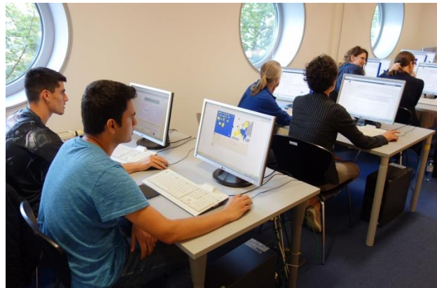
Πιλοτική Εφαρμογή του LIB(e)RO στη Βιέννη

Κατά την διάρκεια των τελευταίων μηνών, οι εταίροι του έργου δοκίμασαν πιλοτικά το LIB(e)RO σε βιβλιοθήκες στην Αυστρία, τη Γερμανία και την Ελλάδα: Συνολικά, πραγματοποιήθηκαν οκτώ δοκιμαστικές εφαρμογές στην οποία οι βιβλιοθηκονόμοι και οι πρόσφυγες είχαν την ευκαιρία να εξερευνήσουν την πλατφόρμα του LIB(e)RO. Έπειτα εξέφρασαν την γνώμη τους σε ένα ερωτηματολόγιο. Τα αποτελέσματα της πιλοτικής εφαρμογής αξιολογήθηκαν και χρησιμοποιήθηκαν για την περαιτέρω βελτίωση των εκατιδευτικών περιεχομένων.