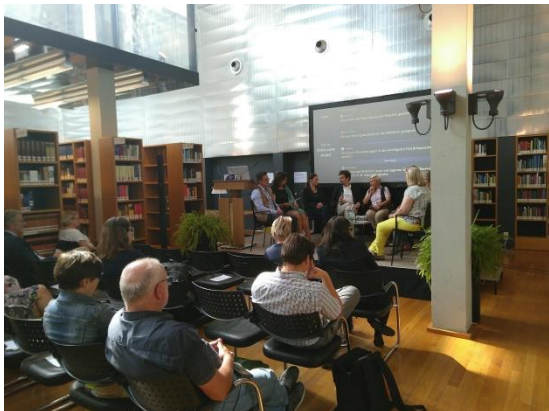
Συζήτηση με το κοινό κατά την διάρκεια της τελικής ημερίδας του LIB(e)RO στο St. Pölten

Περίπου δύο χρόνια έπειτα από την αρχική συνάντηση, οι εταίροι του LIB(e)RO συναντήθηκαν για τελευταία φορά στις 20 Σεπτεμβρίου 2018. Αξιολόγησαν την συνεργασία τους και εξέτασαν και το πιθανό μέλλον του LIB(e)RO με τη μορφή επόμενων έργων που θα χτίσουν πάνω στα αποτελέσματά του.